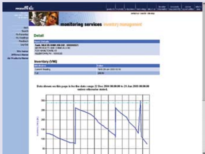
De schermafbeelding hierboven toont de grafische weergave van uw beschikbare voorraad.