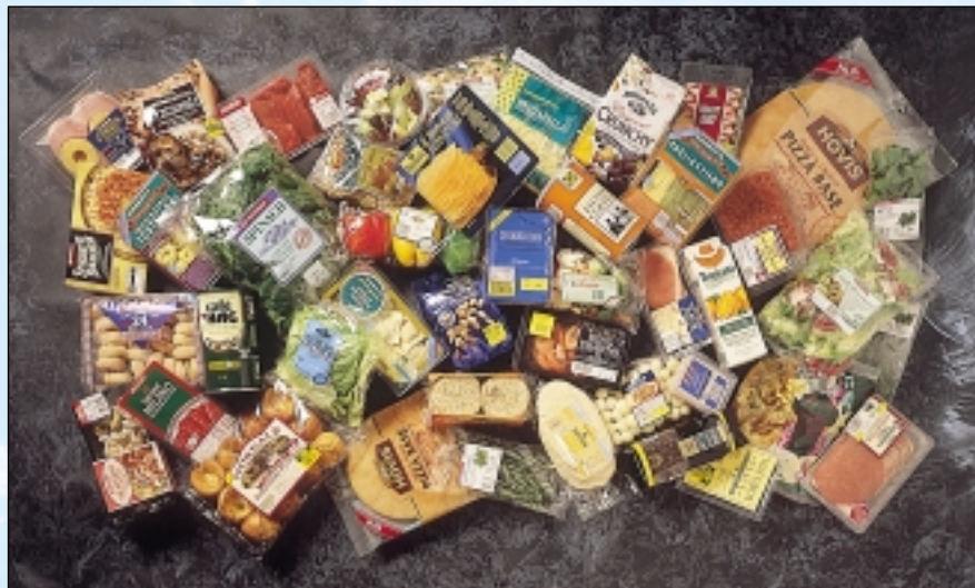
Air Products bietet Ihnen ein komplettes Programm von Produkten und Dienstleistungen rund um den Einsatz von Kohlendioxid.