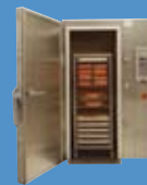
Air Products Cryo-Batch Freshline®

L'armoire réfrigération Cryo-Batch Freshline® d'Air Products met à profit les qualités uniques de l'azote liquide pour une réfrigération ou une surgélation économique et rapide des aliments. Ce surgélateur a été tout spécialement conçu pour répondre aux exigences strictes en matière de cuisson-réfrigération et de cuisson-surgélation. Il convient également parfaitement aux entreprises de transformation de produits alimentaires, ayant besoin de refroidir ou de surgeler des aliments par lot ou en faibles quantités.