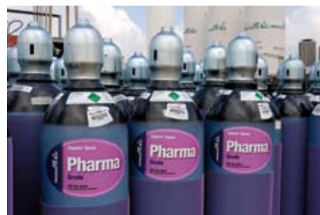
Botellas de grado Pharma

Los métodos analíticos y de producción de Carburos Metálicos, así como los procesos de almacenamiento y distribución, se definen y documentan para garantizar el cumplimiento completo de la Farmacopea Europea (EP) y de la sección II de las BPF (Buenas Prácticas de Fabricación). Carburos Metálicos utiliza métodos y equipos analíticos precisos, como se especifica en la correspondiente monografía de la Farmacopea Europea, los certificados son firmados por una persona cualificada y el proceso de producción y el sistema analítico están completamente validados.